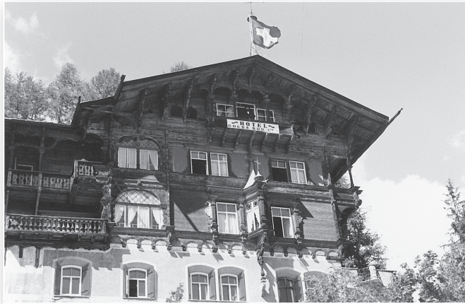
הבנין בסט. מוריץ שבשווייץ

בשבועות ששה הרבי בשווייץ היה משפיע ומאציל מאור החסידות על הנופשים שמילאו את הארץ היפהפייה. מדי יום בין מנחה למעריב מסר הרבי שיעור נפלא, והקהל המרותק האזין שעה ארוכה לדברי התורה המתוקים מדבש.