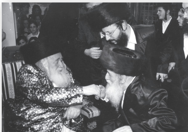
נפשו קשורה בנפשו

אבינו שהה בביתו חולה ומרותק למיטתו. בשנתיים האחרונות לחייו כמעט לא יצא מביתו, וגם בשמחות הרבי לא היה יכול להשתתף.